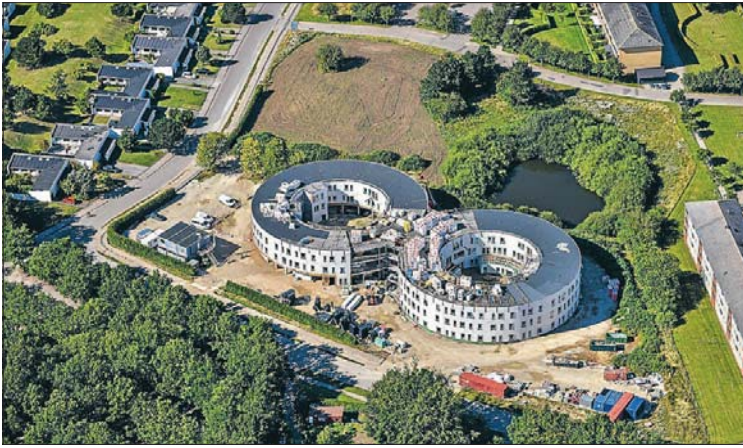
Fremtidens Plejecenter er under opførelse i Holbæk. STB Byg A/S står for opførelsen.

de i maskinrummet, og sørge for en vis overlappning mandskabsmæssigt. Et andet element i at sikre at tingene bliver gjort, er udbredt brug af tjeklister.